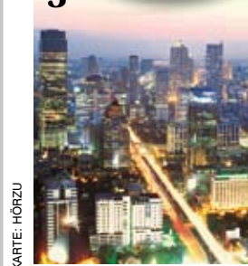
FOTOS: S. 118-119: GETTY IMAGES (3), EISENBERGER/LOOK, HZ, S. 120: GETTY IMAGES (2), SCHAPOWALOW/HUBER, RAINER JAHNS; KARTEN: HORZU